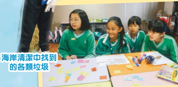
海岸清潔中找到的各類垃圾