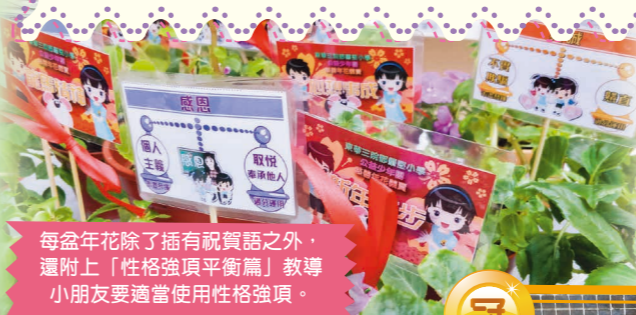
每盆年花除了插有祝賀語之外，還附上「性格強項平衡篇」教導小朋友要適當使用性格強項。