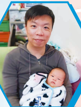
同爸爸影張相，笑下啦

黃「細佬」剛於一月出世啦，感恩太太在懷孕到小朋友出世的過程也很順利，小朋友的身體也很健康。希望你健康康、開開心心成長。