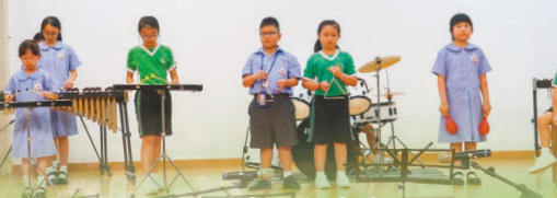
敲擊樂組示範表演，吸引着大家傾耳細聽。