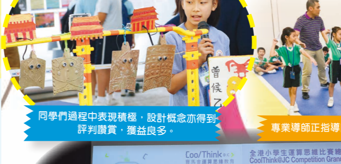
同學們過程中表現積極，設計概念亦得到評判讚賞，獲益良多。