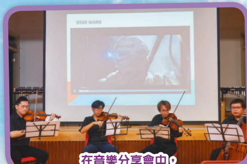
在音樂分享會中，弦樂導師示範用小提琴拉奏 Star Wars