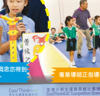
專業導師正指導同學投擲紙飛機的正確姿勢。

本校推行 STEM 教育目標讓學生通過解決日常生活問題，思考解決方案和創新設計，加強他們綜合和應用跨學科知識與技能的能力，提升學生的創造力、協作和解決問題等能力，並培養創新及探知精神，為啟發學生在日常生活中的數碼創意，並為他們應對未來各個領域的挑戰作好準備。