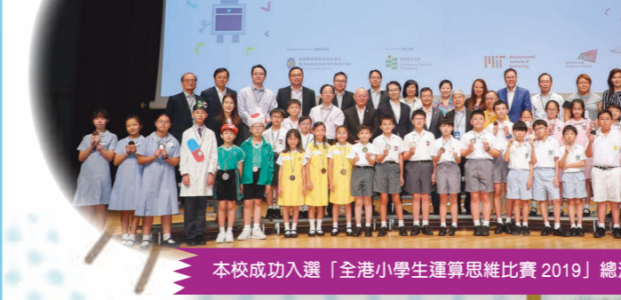
本校成功入選「全港小學生運算思維比賽 2019」總決賽。