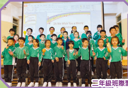
三年級班際聖誕歌曲歌唱比賽，大家都投入演出