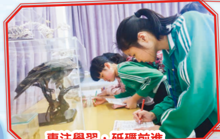
專注學習，砥礪前進