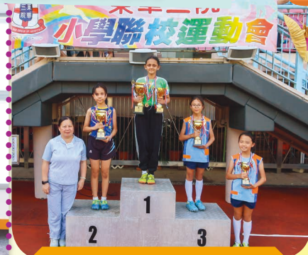
東華三院小學聯校運動會比賽