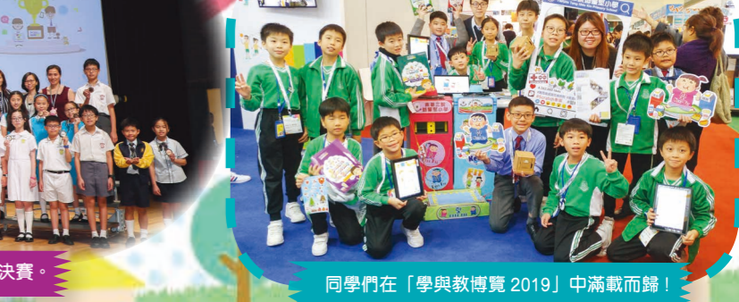
同學們在「學與教博覽 2019」中滿載而歸！