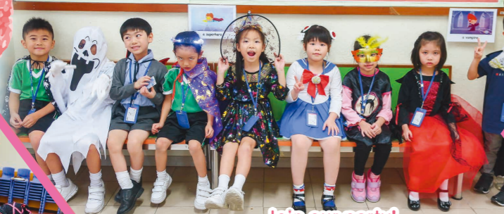
Join our party!