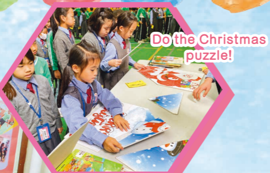
Do the Christmas puzzle!