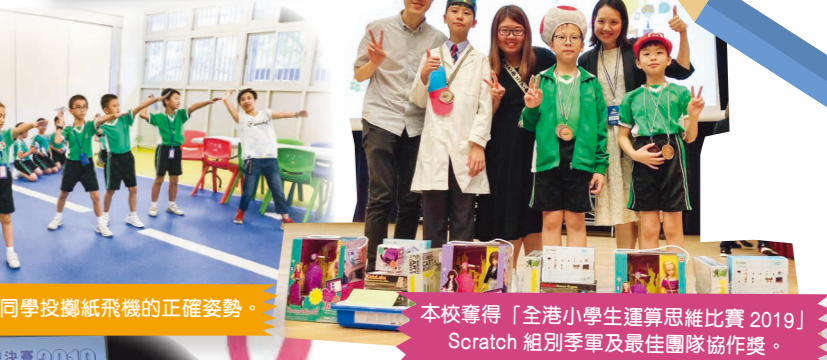
本校奪得「全港小學生運算思維比賽 2019」Scratch 組別季軍及最佳團隊協作獎。

學生在「全港小學生運算思維比賽 2019」憑藉作品「堅 KeepFit」在 Scratch 組別當中獲得季軍，因此 TVB《學是學非》節目選定了本校為拍攝及採訪的對象。拍攝隊伍訪問了老師及學生得獎作品的創作意念、編程學習心得及學生使用得獎作品的過程。