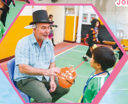
Come and learn some words!