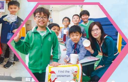
Find the snowman!