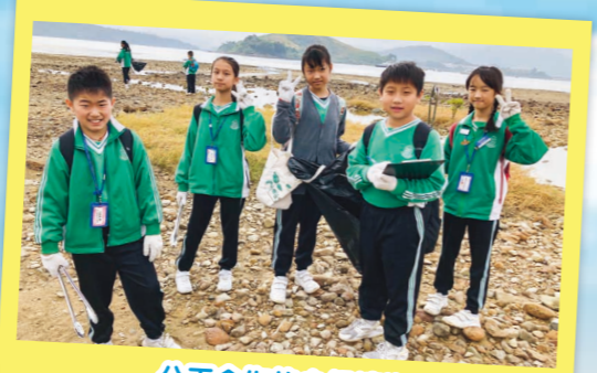
分工合作的小組清潔