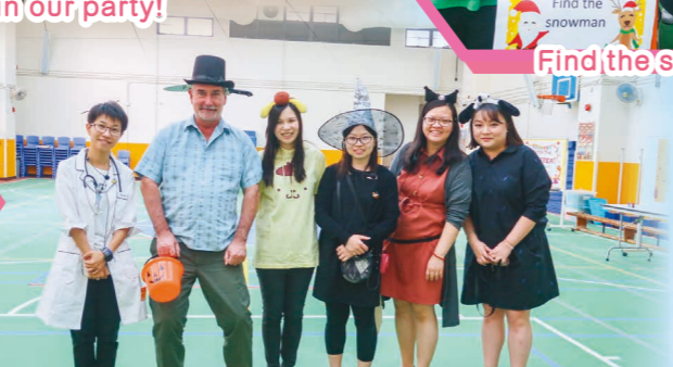
Our teachers also dress up for the English Halloween Day!