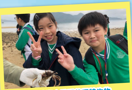
海岸清潔中發現的獨特生物