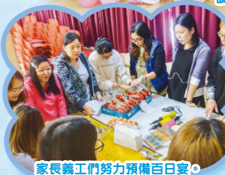
家長義工們努力預備百日宴。