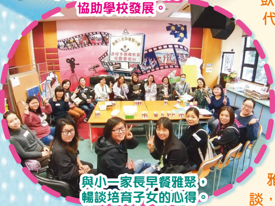
與小三家長早餐雅聚，暢談培育子女的心得。