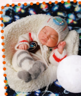
太空人不容易當啊！

大家好，我是小蘋果！我十五日大的時候，爸爸和媽媽帶我去影樓影相。攝影師讚我乖，還讓我做小model拍平面照呢。看看我其中兩個造型吧！