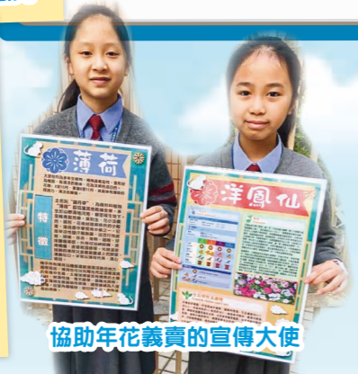
協助年花義賣的宣傳大使