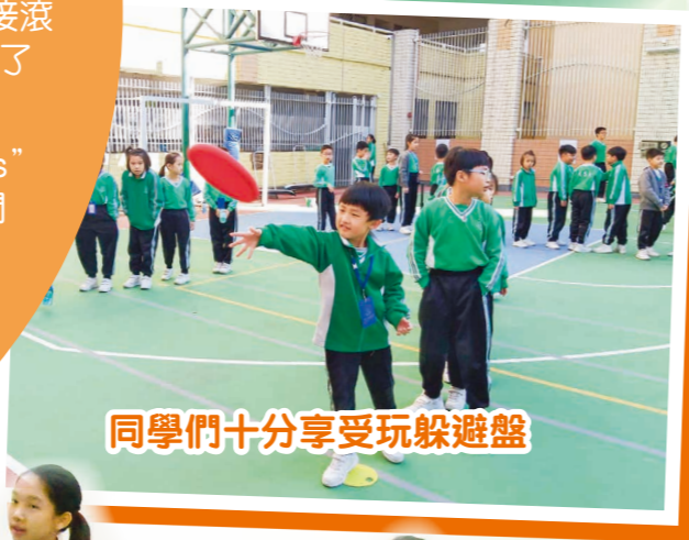
同學們十分享受玩躲避盤