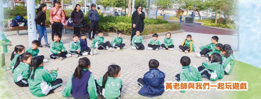
黃老師與我們一起玩遊戲