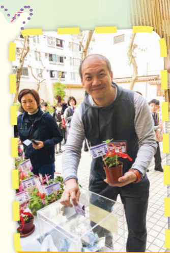
老師和家長都熱心捐助