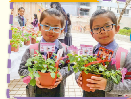
在家中可以一起學習照料花朵了！