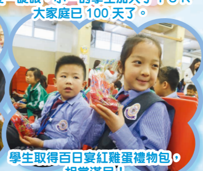
學生取得百日宴紅雞蛋禮物包，相當滿足!