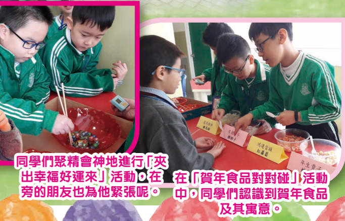
同學們聚精會神地進行「夾出幸福好運來」活動，在「賀年食品對對碰」活動中，同學們認識到賀年食品及其寓意。