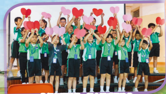
全級各班同學一起合唱感恩歌曲，好WARM呀!