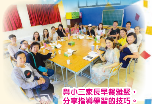
與小三家長早餐雅聚，分享指導學習的技巧。