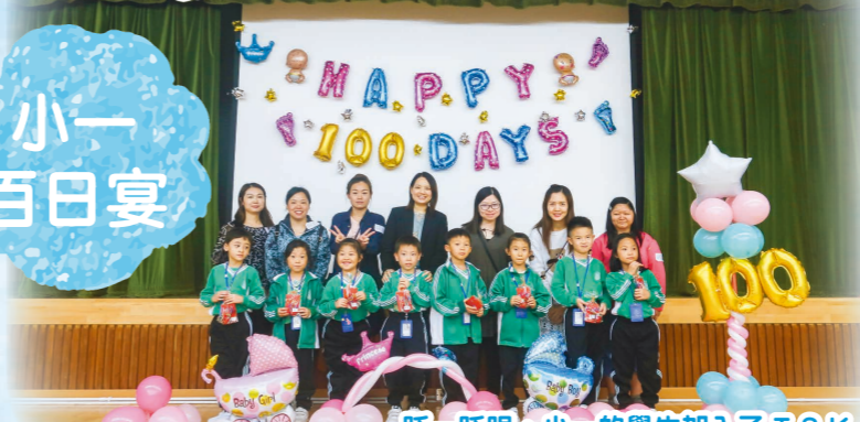
眨一眨眼，小一的學生加入了TSK大家庭已100天了。