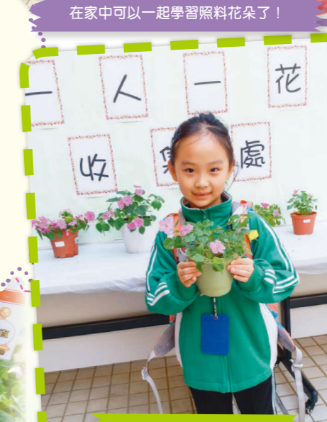
同學帶回盆栽參加比賽