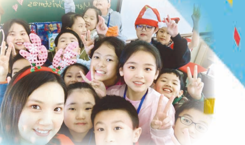
到訪各教室與同學歡渡聖誕聯歡會