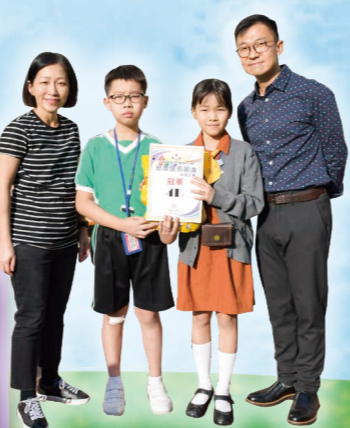
班際感恩歌曲歌唱比賽有結果了!