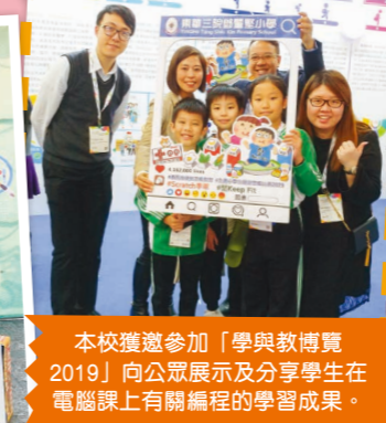
本校獲邀參加「學與教博覽 2019」向公眾展示及分享學生在電腦課上有關編程的學習成果。