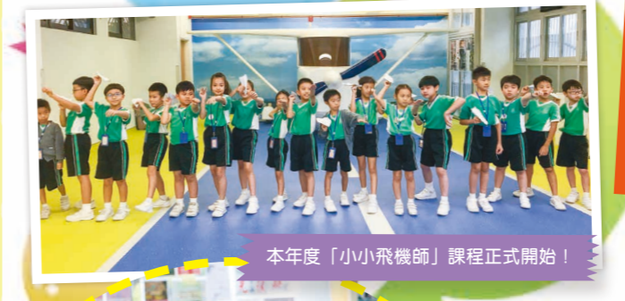
本年度「小小飛機師」課程正式開始！