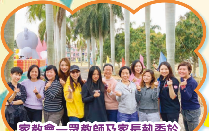
家教會一眾教師及家長執委於錦田俱樂部留倩影