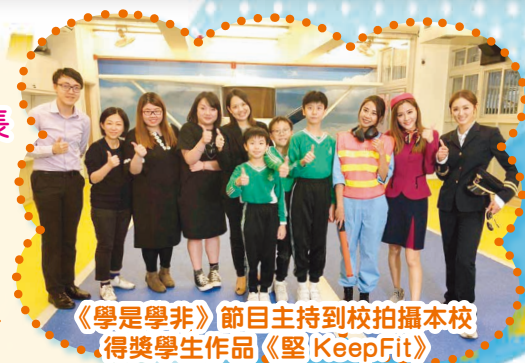
《學是學非》節目主持到校拍攝本校得獎學生作品《堅KeepFit》

我期望每一位同學都能在東華三院鄧肇堅小學享受校園生活，健康成長，秉承學校 TSK 的教育理念：Be TOUGH，做個堅毅自強的孩子，遇到逆境或不如意的事，仍能屢敗屢戰；Be STRONG，肯定自己的價值，發揮潛能，盡展所長；Be KIND，在群體生活中，重視與人的關係，待人以寬以誠。只要關注身心靈健康，建立待人接物的良好品德，成功就在不遠處。