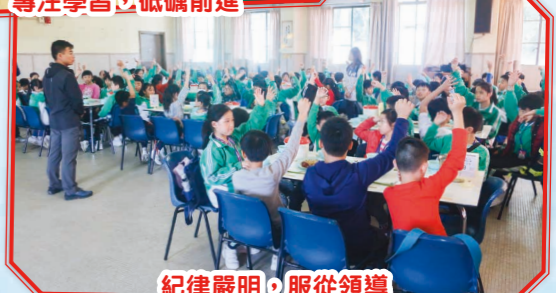
紀律嚴明，服從領導