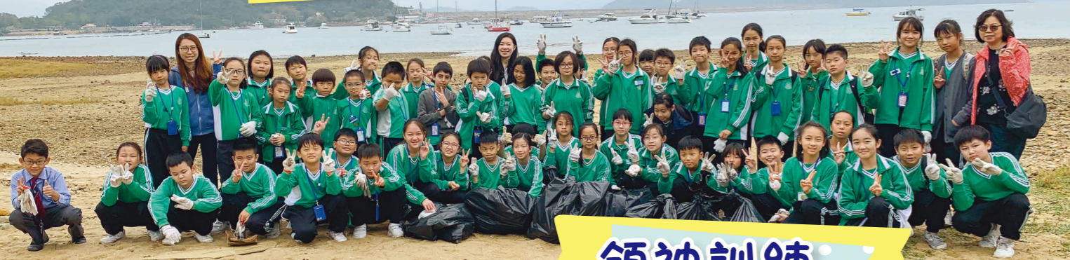
我們收集了超過 50 公斤的垃圾