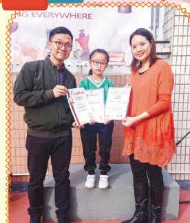
國際藝穗音樂節大賽 2019