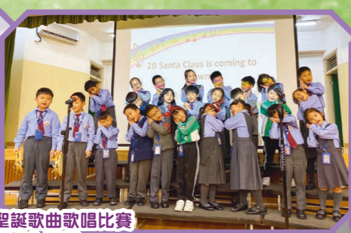
一起感受聖誕氣氛