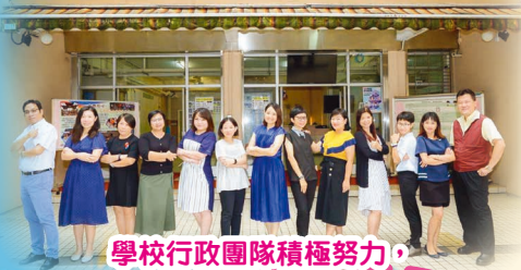
學校行政團隊積極努力，協助學校發展。