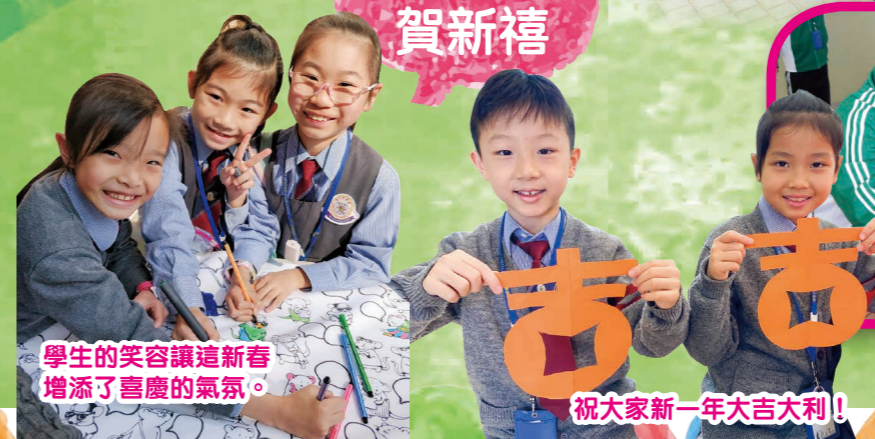
學生的笑容讓這新春增添了喜慶的氣氛。