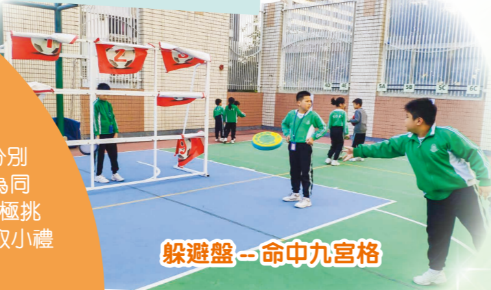
躲避盤—命中九宮格

舞蹈方面，適逢聖誕節，以一首家喻戶曉的“Jingle Bells”配以舞蹈，為是次全城起動在肇堅的活動帶來高潮。同學們不單在小息時一起載歌載舞，還組成了一隊HIP-HOP街舞隊，分別在聖誕聯歡會及放學進行了一次快閃放學之旅，大伙們都看得如痴如醉，甚獲好評，為是次全城起動在肇堅帶來完美的謝幕。