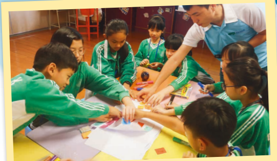
工作坊中小領袖們積極構思