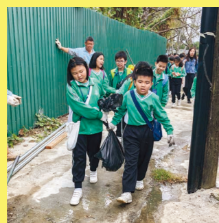
要合力才能把海岸垃圾搬運到去垃圾站

為了鼓勵更多同學參與服務，從中學會關愛身邊有需要的人，也能夠發揮領袖能力，本年度有更多同學參與公益少年團，而當中大部分同學都參與籌備及進行「環保為公益－慈善年花義賣活動 2019」。在老師們和工友們的指導下，由整理花苗開始，到每天灌溉、照料，以及裝飾、宣傳，每位參與的團員都十分投入和努力。