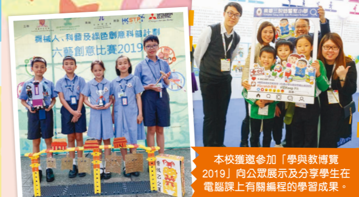
本校學生在「六藝創意比賽」獲得小學「樂」組二等獎。