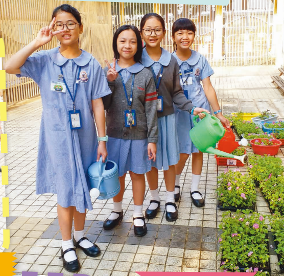
環保大使為花苗澆水