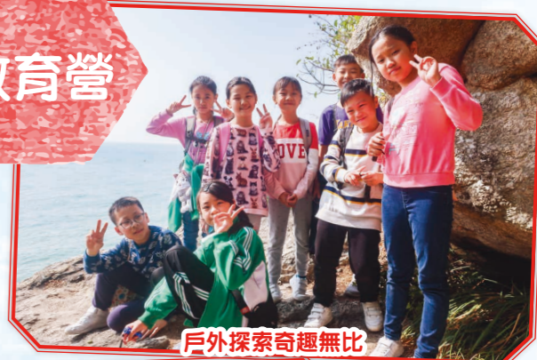
戶外探索奇趣無比