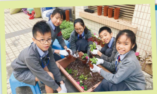
公益少年團整理年花義賣的花苗